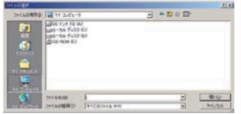
<ファイル参照の画面イメージ>

※上記画面はご使用のパソコンにより異なります。 ※ファイル名は半角英数で20文字以内としてください。(拡張子を含む)半角カナはご利用できません。