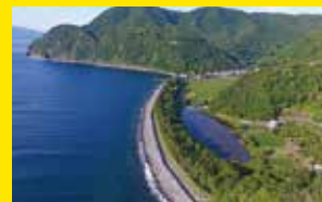
井田の明神池[沼津市]