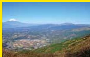
玄岳からの眺望[函南町]