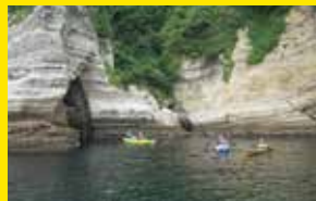
シーカヤック[南伊豆町]