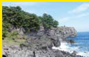
城ヶ崎河岸[伊東市]