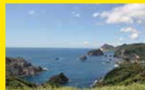
あいあい岬[南伊豆町]