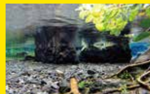
孤池・白滝公園[三島市]