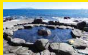
熱川高磯の湯[東伊豆町]