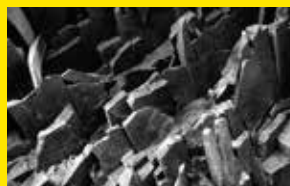
愛鷹山の板状節理[長泉町]