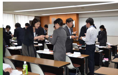
新入社員ビジネスマナー研修