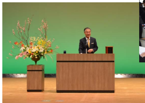
さんしん同友会勉強会